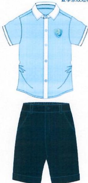
夏季礼仪短裤/男款