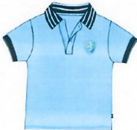
夏季短袖Polo衫/男女同款

三湾湾科技城 上海世外教育附属外国语学校 Sanya Haitian Bay Science and Technology City Foreign Language School Affiliated to WFL Education