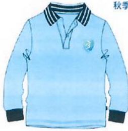
秋季长袖Polo衫/男女同款

三湾湾科技城 上海世外教育附属外国语学校 Sanya Haitian Bay Science and Technology City Foreign Language School Affiliated to WFL Education