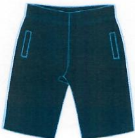
夏季运动短裤/男女同款