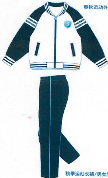
春秋运动外套/男女同款

三亚崖州湾科技城 上海世外教育附属外国语学校 Sanya Yezhou Bay Science and Technology City Foreign Language School Affiliated to WSE Education