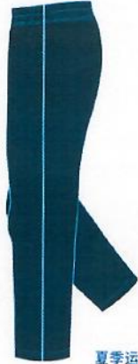
夏季运动长裤/男女同款